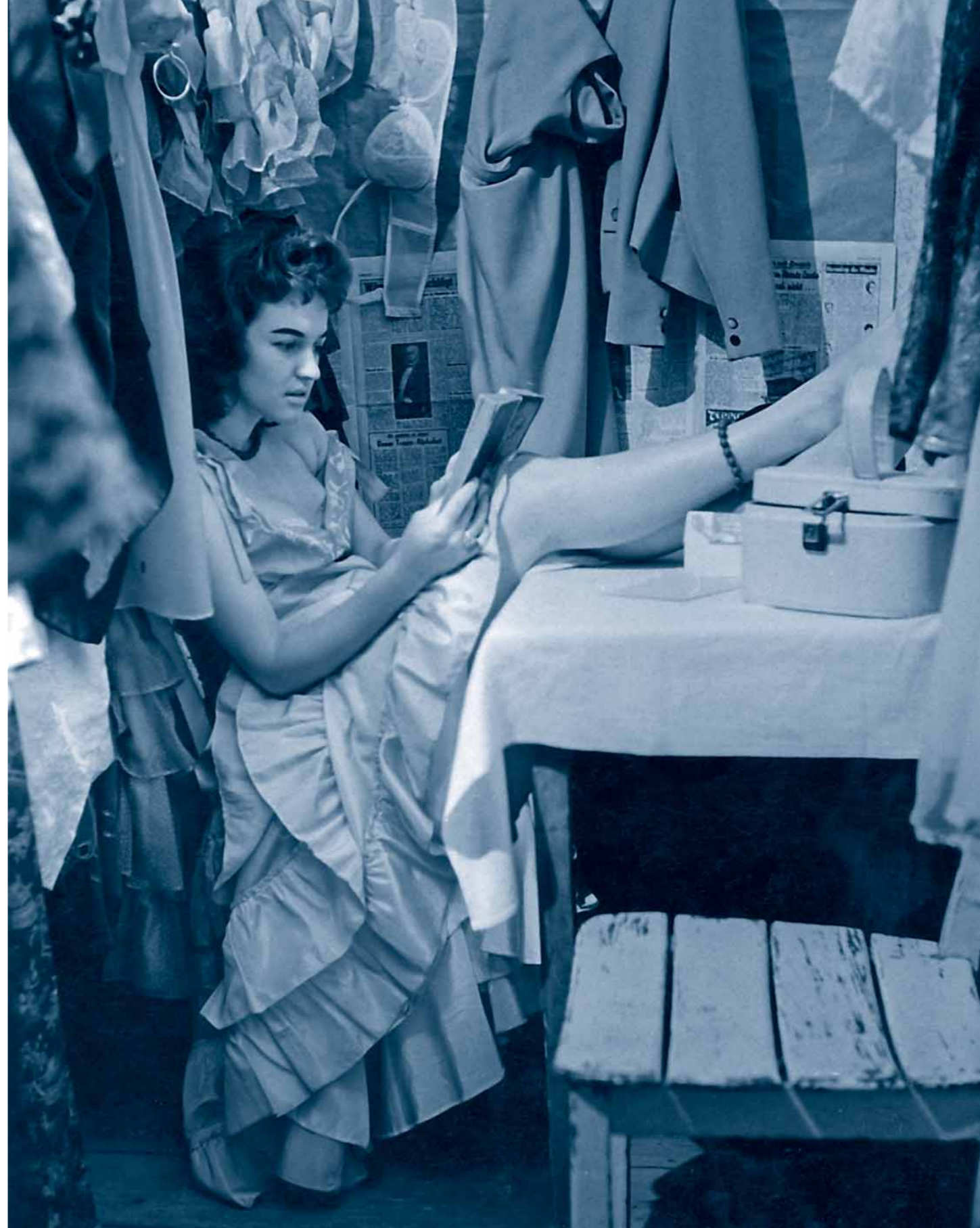
Hinter den Kulissen der FEMINA BAR | Schillerstraße | 1959