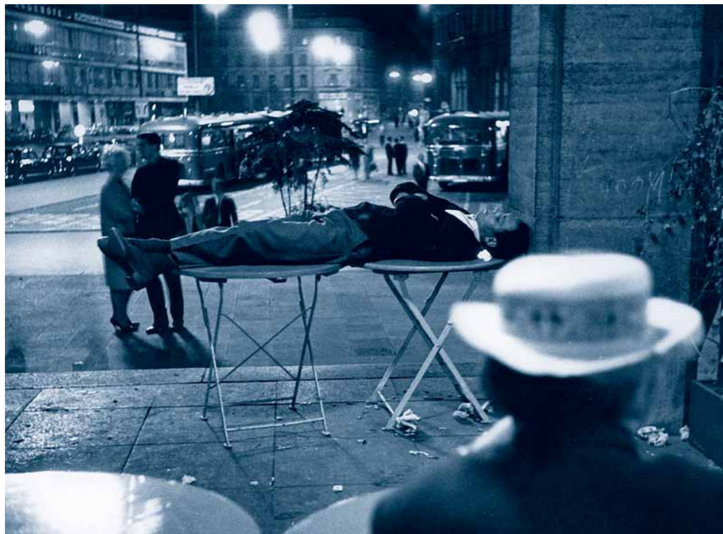
Oktoberfestzeit, nachts am Hauptbahnhof | 1973