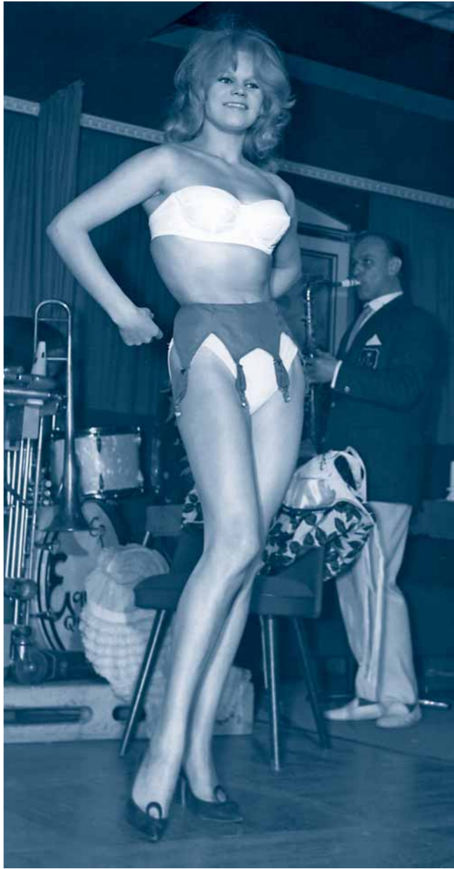
Tänzerin in der EVE BAR | Karolinenplatz | 1959