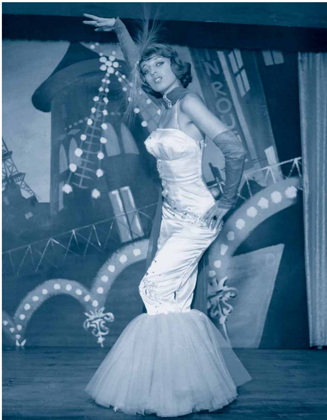
Show im MOULIN ROUGE | Herzogspitalstraße | 1956