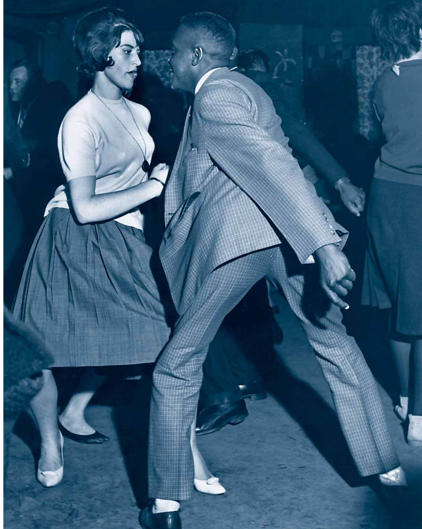
Tänzer im Schwarzenclub BIRDLAND | Kirchenstraße | 1961